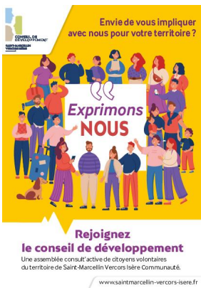
_01/01/2023 Conseil de developpement : plaquette presentation