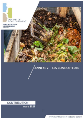
_02/03/2021 Conseil de developpement : avis : Biodéchets - annexe2 - les composteurs