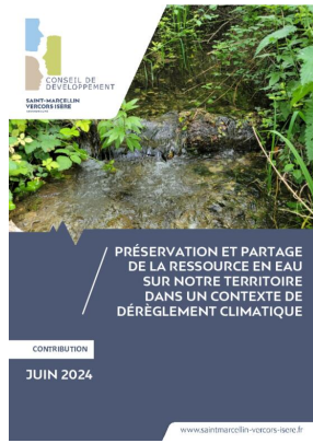
_01/06/2024 Conseil de developpement : avis : partage de l'eau