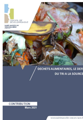
_04/03/2021 Conseil de developpement : avis : Biodéchets