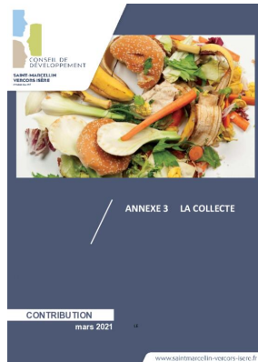
_01/03/2021 Conseil de developpement : avis : Biodéchets - annexe3 - la collecte