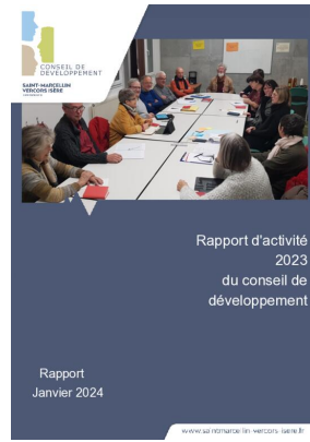
_01/01/2024 Conseil de developpement : rapport-activite 2023