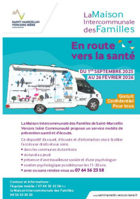
_01/07/2025 En route vers la santé : dates septembre 2025- février 2026