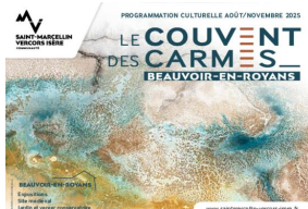
_10/07/2025 - @SMVIC Couvent des Carmes : programmation culturelle S2 2025 Auteur : SMVIC