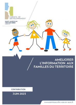
_01/06/2023 Conseil de developpement : avis : Améliorer l'information aux familles