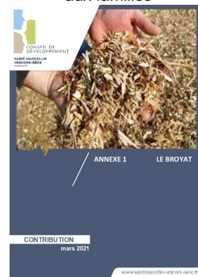
_03/03/2021 Conseil de developpement : avis : Biodéchets - annexe1 - le broyat