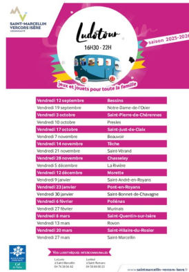
_01/07/2025 - ©SMVIC Ludotours : dates saison 2025-26 Auteur : SMVIC