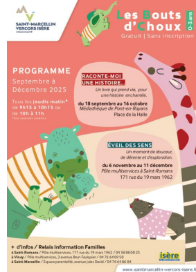
_01/07/2025 - ©SMVIC Lieu Accueil Enfant-Parent : Saint-Romans : date Trim1-2025 Auteur : SMVIC