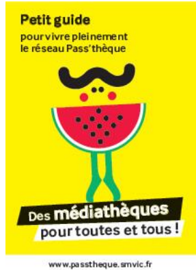
_ - @SMVIC Pass-theque : guide emprunteur Auteur : SMVIC