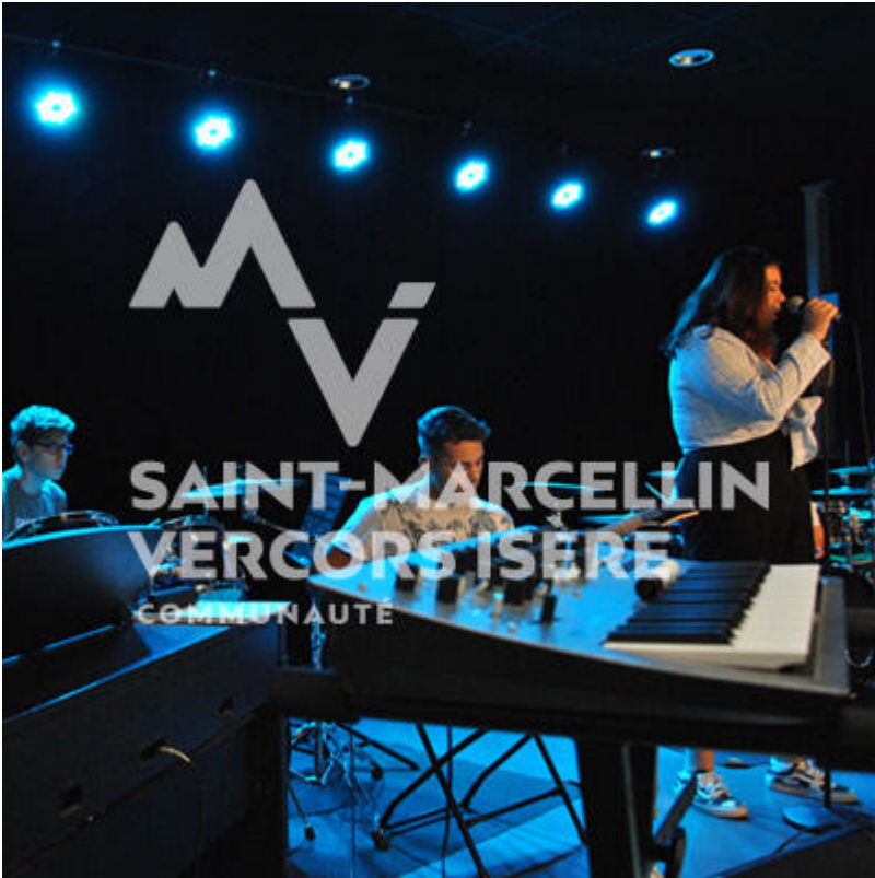
Ecole de musique intercommunale, à Saint-Romans