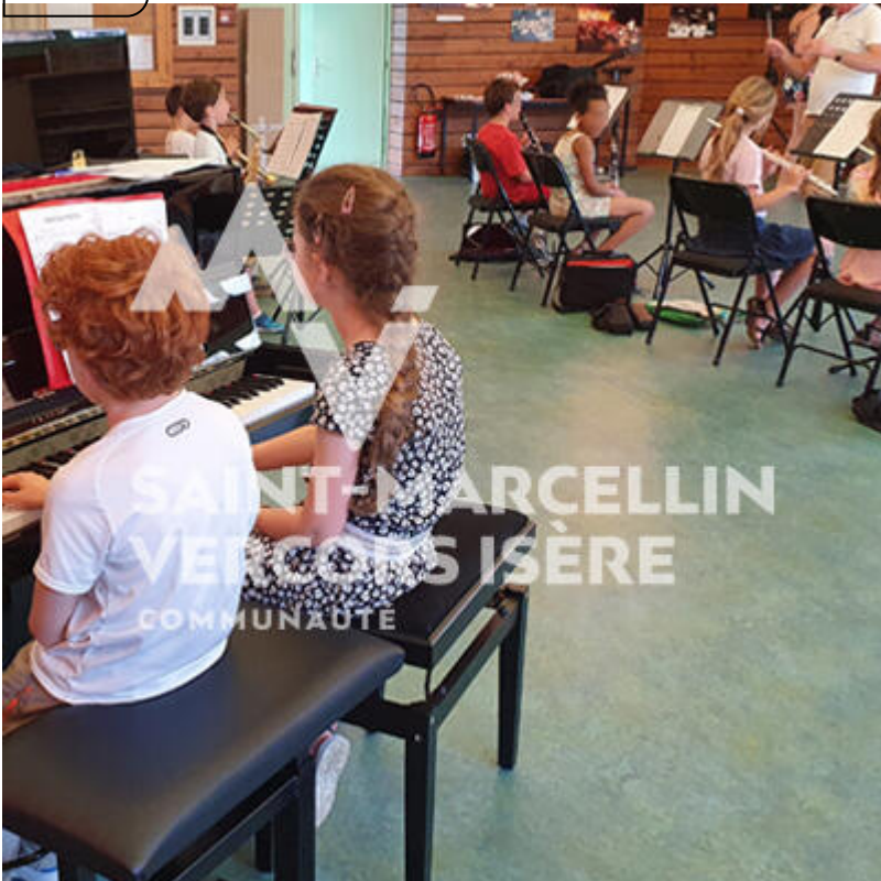
Ecole de musique intercommunale, à Vinay Vinay

Enseignement et pratique de la musique pour les enfants et adultes d'infos