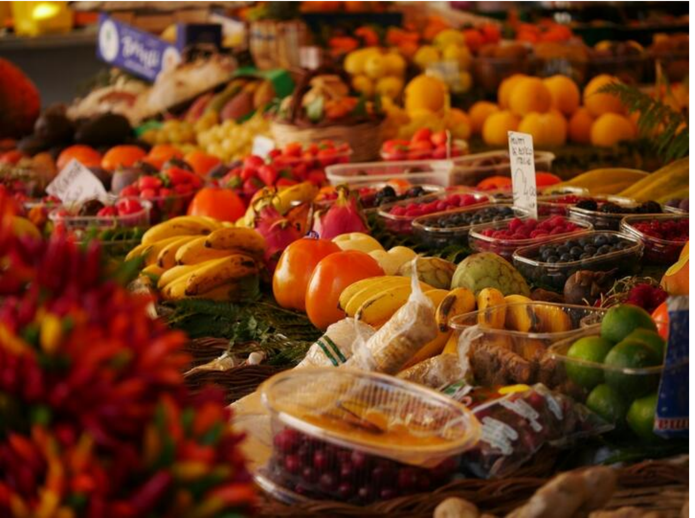
Marché de producteurs 38470 Vinay Petit marché de producteurs du territoire Plus d'infos lun. 11 mai