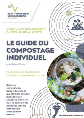
_29/12/2024 Guide-du- compostage-individuel