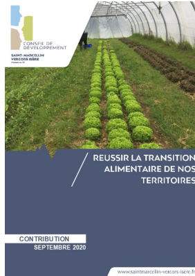
_01/09/2020 Conseil de developpement : avis : Transition alimentaire