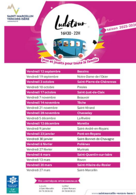
_01/07/2025 - ©SMVIC Ludotours : dates saison 2025-26 Auteur : SMVIC