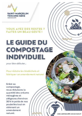
_29/12/2024 Guide-du- compostage-individuel