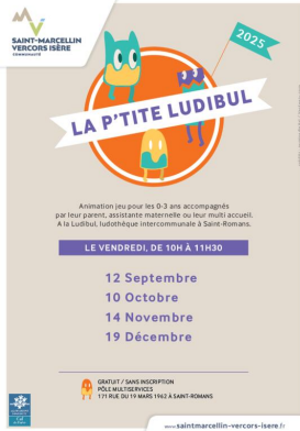
_01/07/2025 - ©SMVIC P'tite Ludibul : dates 2025 Auteur : SMVIC