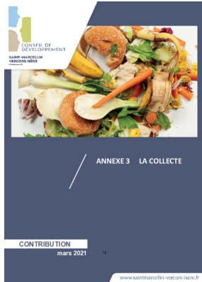
_01/03/2021 Conseil de developpement : avis : Biodéchets - annexe3 - la collecte