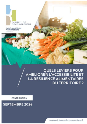
_01/09/2024 Conseil de developpement : avis : resiliance alimentaire