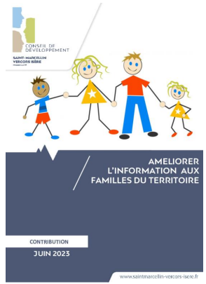
_01/06/2023 Conseil de developpement : avis : Améliorer l'information aux familles