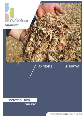
_03/03/2021 Conseil de developpement : avis : Biodéchets - annexe1 - le broyat