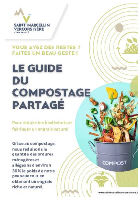
_28/12/2024 Guide-du- compostage-partagé