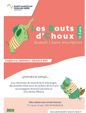
_01/06/2025 LAEP : bout d'choux -programme : sept-dec_2025 Auteur : SMVIC