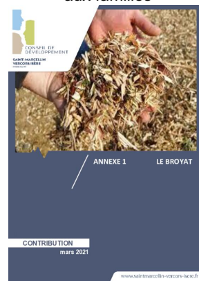
_03/03/2021 Conseil de developpement : avis : Biodéchets - annexe1 - le broyat