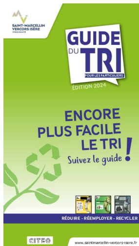
_30/12/2024 Guide du tri des déchets ménagers