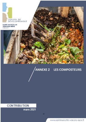
_02/03/2021 Conseil de developpement : avis : Biodéchets - annexe2 - les composteurs