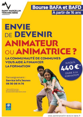
_01/05/2025 - ©SMVIC Aide BAFA-BAFD SMVIC Auteur : SMVIC