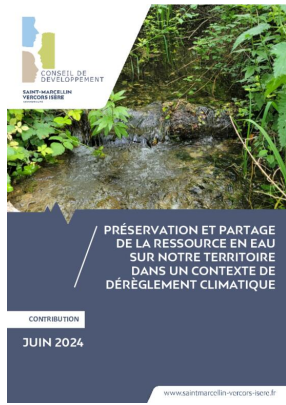
_01/06/2024 Conseil de developpement : avis : partage de l'eau