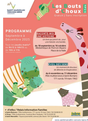
_01/07/2025 - ©SMVIC Lieu Accueil Enfant-Parent : Saint-Romans : date Trim1-2025 Auteur : SMVIC