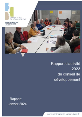
_01/01/2024 Conseil de developpement : rapport-activite 2023