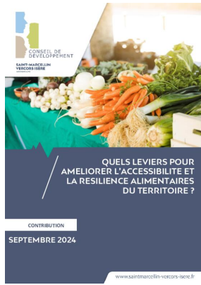
_01/09/2024 Conseil de developpement : avis : resiliencie alimentaire