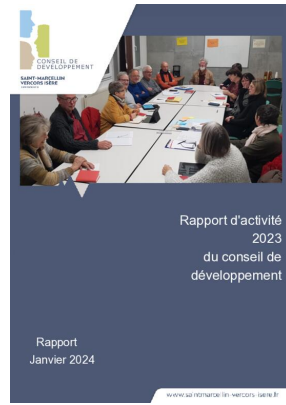
_01/01/2024 Conseil de developpement : rapport-activite 2023