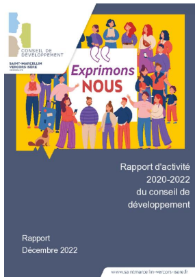
_01/12/2022 Conseil de developpement : rapport-activite 2020-22