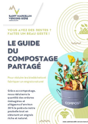
_28/12/2024 Guide-du- compostage-partagé