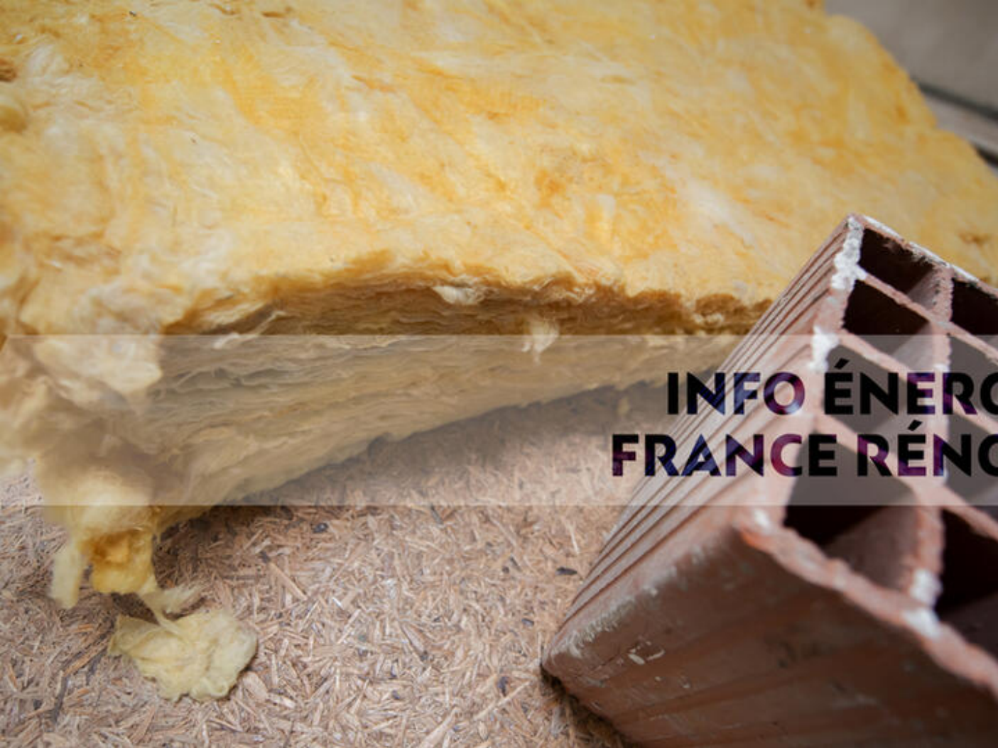
Permanence : Info énergie – France Rénov'