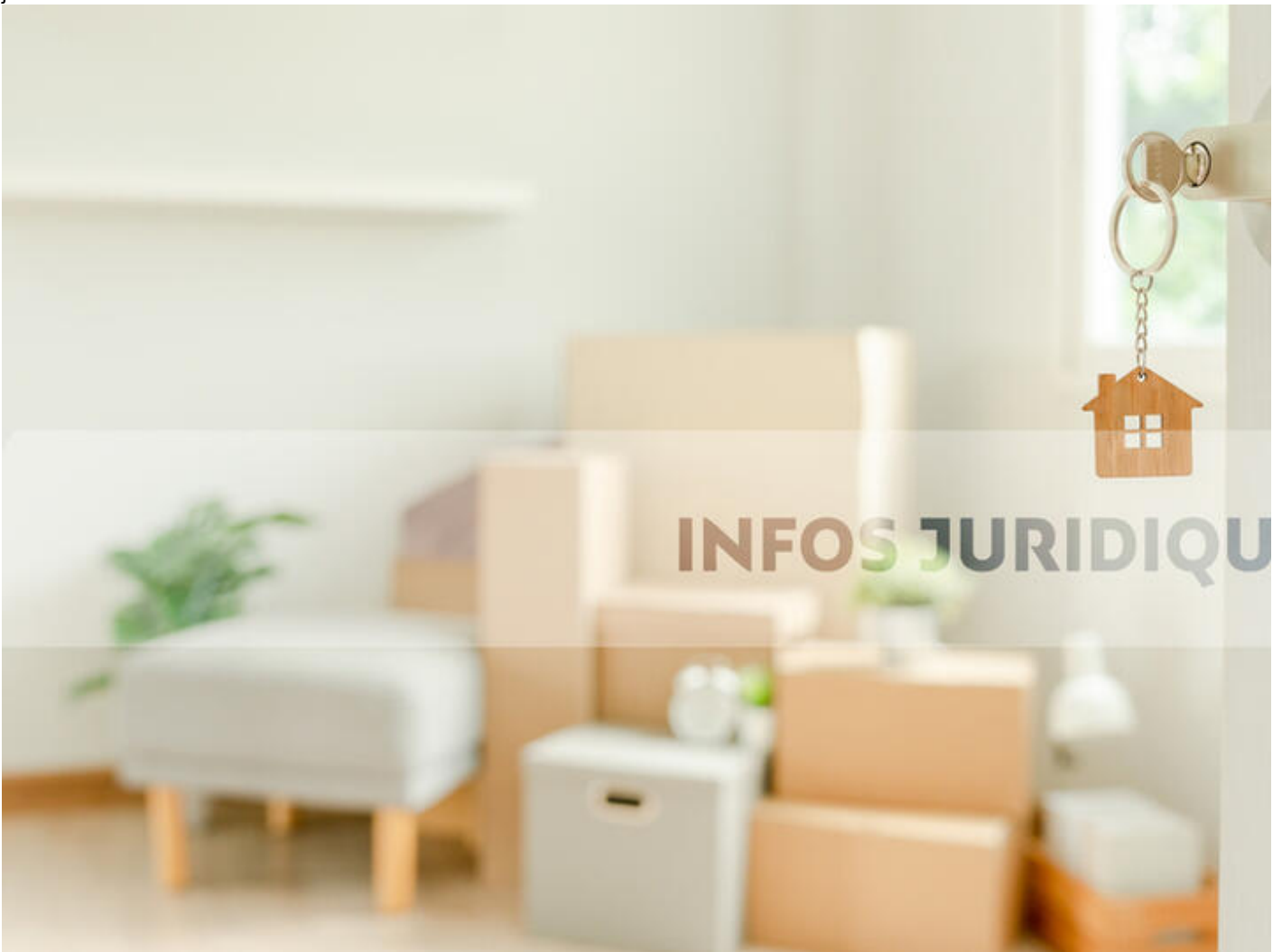
Permanence : Infos juridiques - habitat