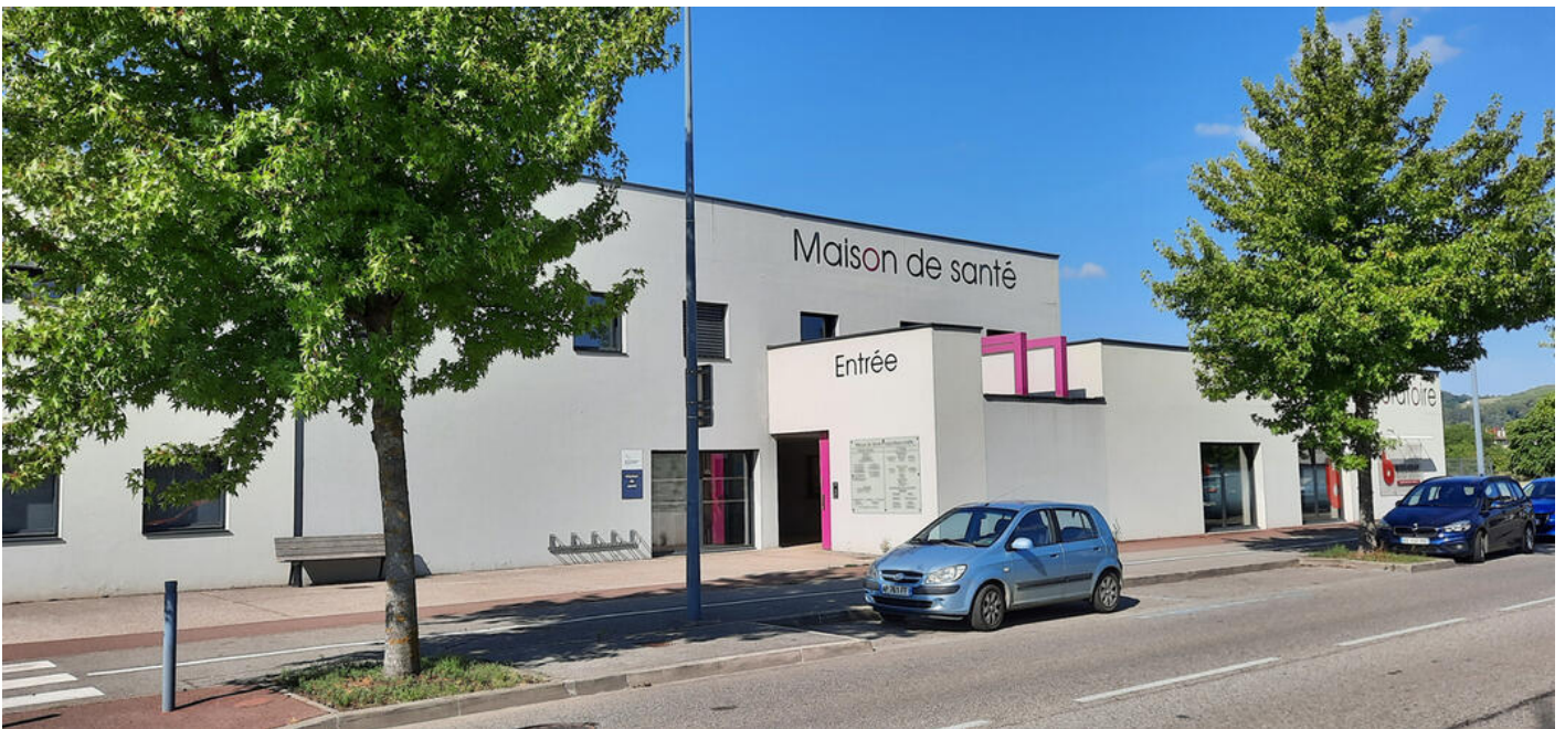
Maison intercommunale de santé à Saint-Marcellin