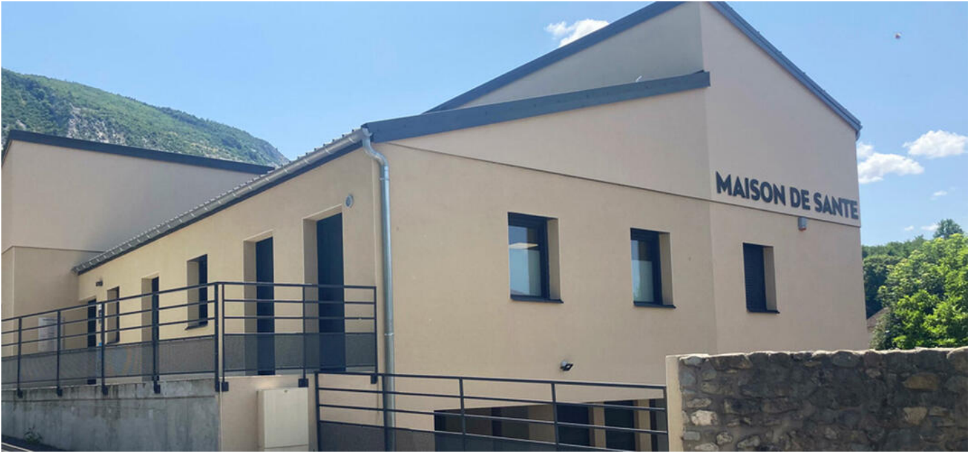
Maison intercommunale de santé à Pont-en-Royans