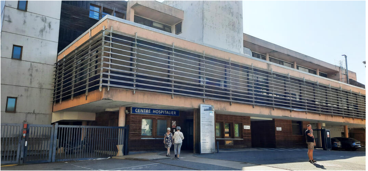
Centre hospitalier à Saint-Marcellin