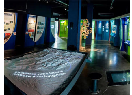
Musée de l'eau