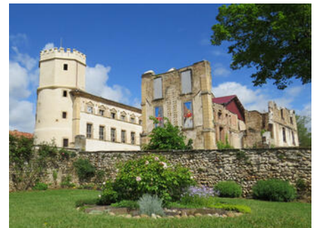
Château de l'Arthaudière