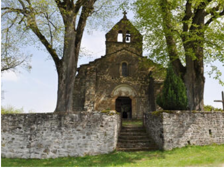
Chapelle Saint-Jean le Fromental