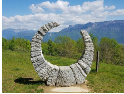
Sculptures aux 4 vents