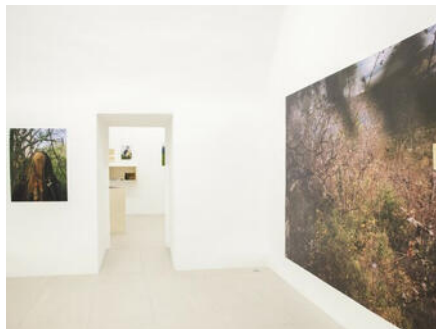
Centre d'art contemporain