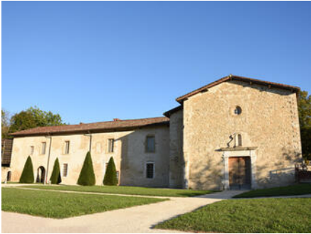
Couvent des Carmes

Cette page propose des portes d'entrée vers les lieux majeurs d'exposition du territoire. Laissez-vous tenter.