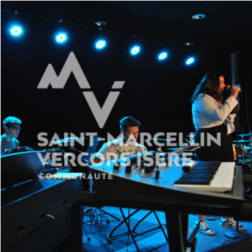
Ecole de musique intercommunale, à Saint-Romans Saint-Romans 04 76 36 69 78 Contacter par mail Enseignement et pratique de la musique pour les enfants et adultes d'infos