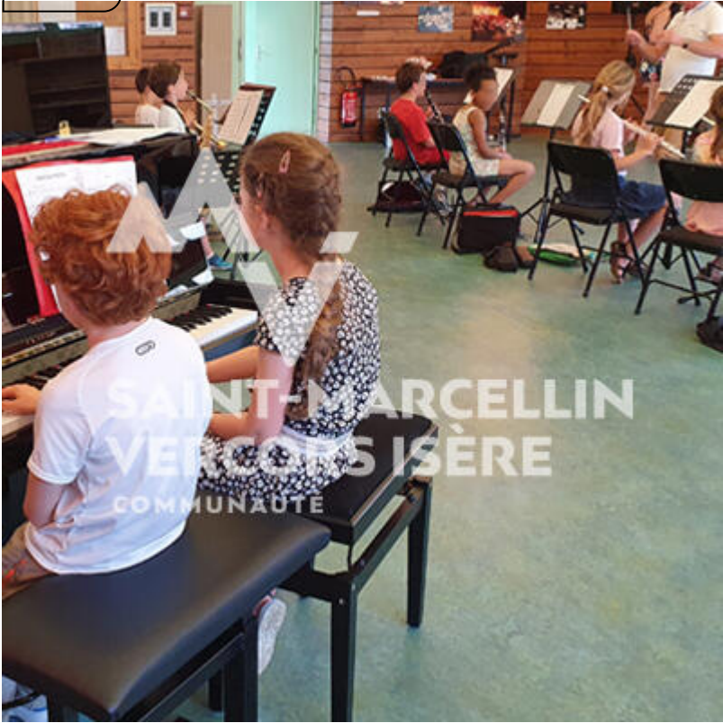
Ecole de musique intercommunale, à Vinay Vinay