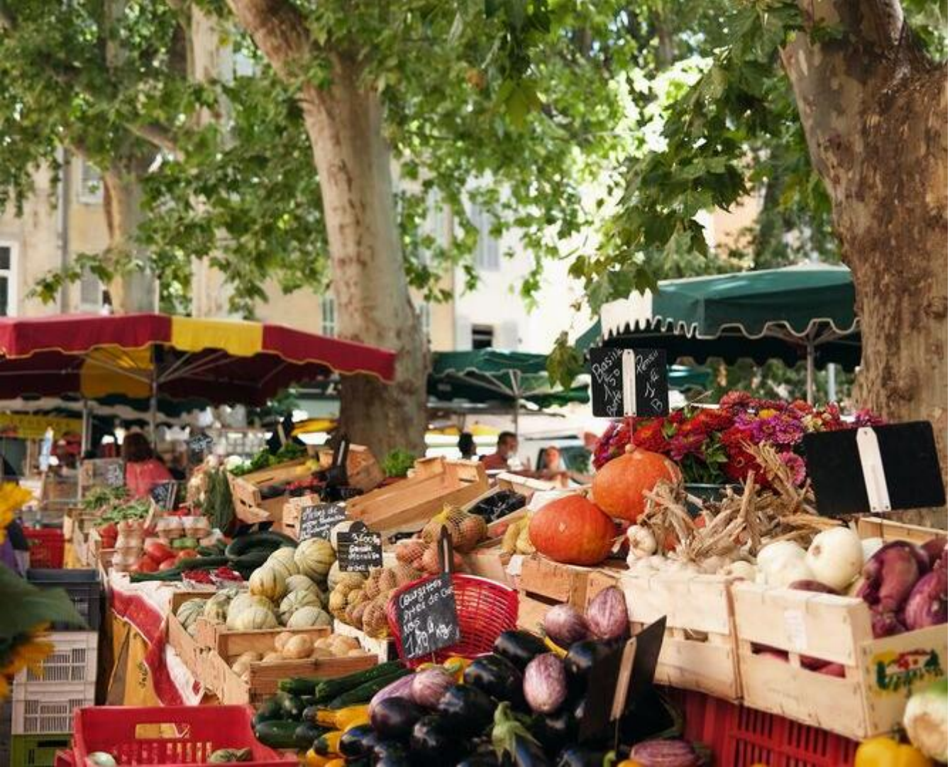
Marché alimentaire de Pont en Royans 38680 Pont-en-Royans Petit marché alimentaire Plus d'infos mer. 24 juin