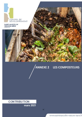
_02/03/2021 Conseil de developpement : avis : Biodéchets - annexe2 - les composteurs