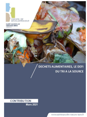
_04/03/2021 Conseil de developpement : avis : Biodéchets