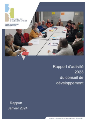
_01/01/2024 Conseil de developpement : rapport-activite 2023