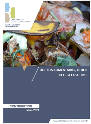
_04/03/2021 Conseil de developpement : avis : Biodéchets