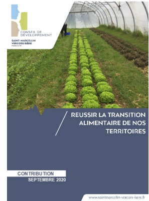
_01/09/2020 Conseil de developpement : avis : Transition alimentaire