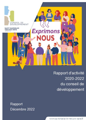
_01/12/2022 Conseil de developpement : rapport-activite 2020-22