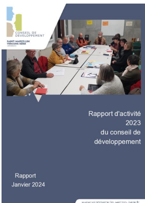
_01/01/2024 Conseil de developpement : rapport-activite 2023