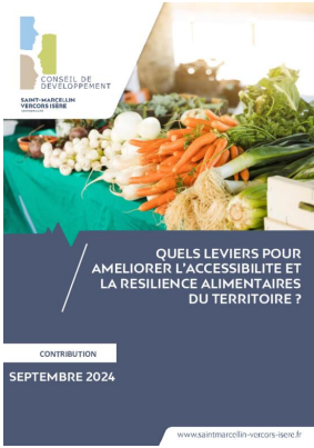
_01/09/2024 Conseil de developpement : avis : resiliance alimentaire