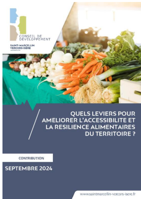
_01/09/2024 Conseil de developpement : avis : resiliance alimentaire