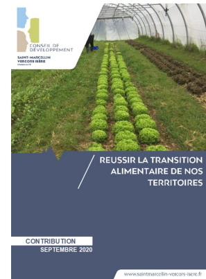
_01/09/2020 Conseil de developpement : avis : Transition alimentaire