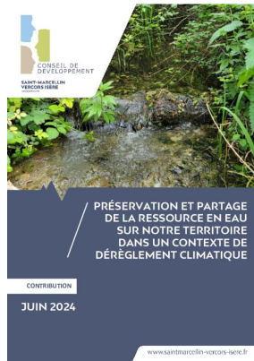
_01/06/2024 Conseil de developpement : avis : partage de l'eau