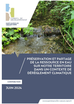
_01/06/2024 Conseil de developpement : avis : partage de l'eau