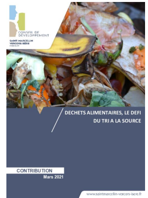
_04/03/2021 Conseil de developpement : avis : Biodéchets