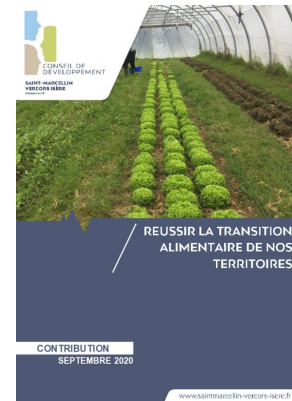
_01/09/2020 Conseil de developpement : avis : Transition alimentaire