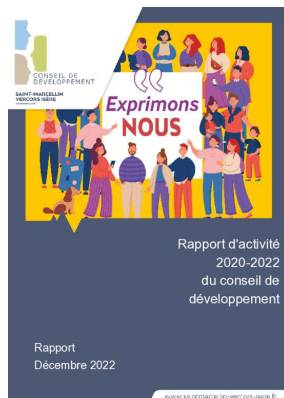
_01/12/2022 Conseil de developpement : rapport-activite 2020-22