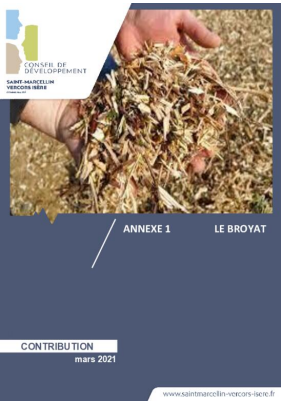
_03/03/2021 Conseil de developpement : avis : Biodéchets - annexe1 - le broyat