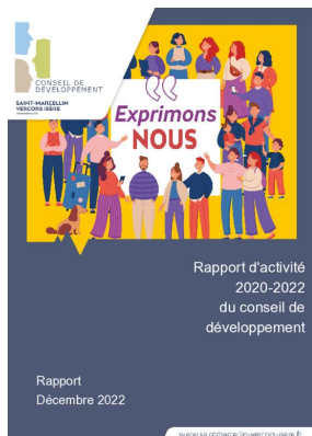
_01/12/2022 Conseil de developpement : rapport-activite 2020-22