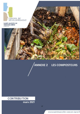
_02/03/2021 Conseil de developpement : avis : Biodéchets - annexe2 - les composteurs