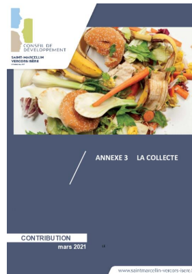
_01/03/2021 Conseil de developpement : avis : Biodéchets - annexe3 - la collecte