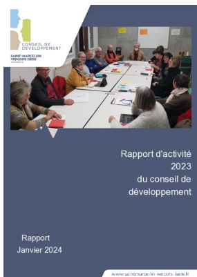
_01/01/2024 Conseil de developpement : rapport-activite 2023