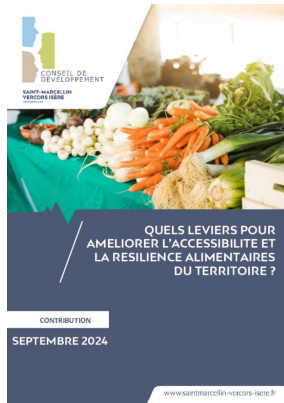
_01/09/2024 Conseil de developpement : avis : resiliance alimentaire