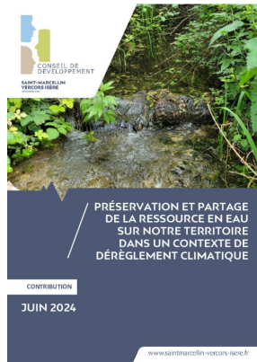
_01/06/2024 Conseil de developpement : avis : partage de l'eau