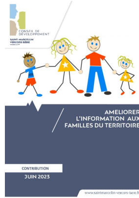
_01/06/2023 Conseil de developpement : avis : Améliorer l'information aux familles