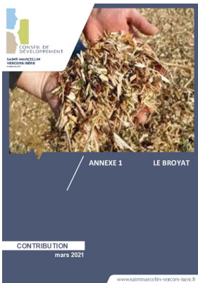
_03/03/2021 Conseil de developpement : avis : Biodéchets - annexe1 - le broyat