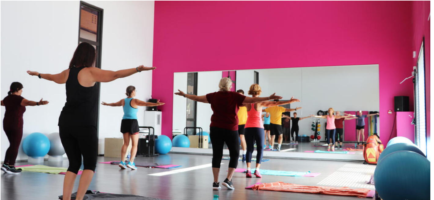
Cours de fitness